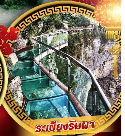
ระบียงริมผา