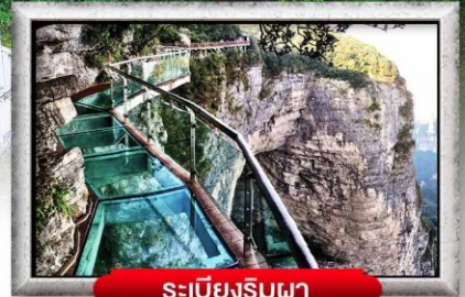
ระเบียงรินผา